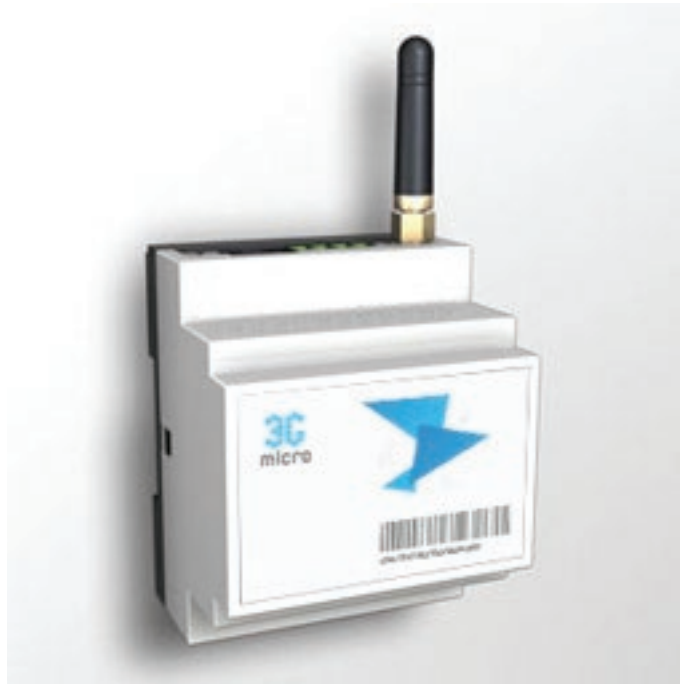
Рисунок 5.1 - Внешний вид GSM концентратора.