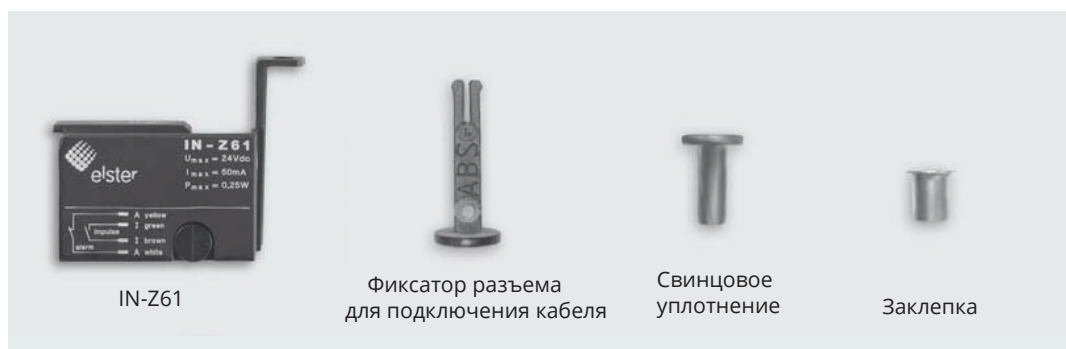
Схема контактов датчика